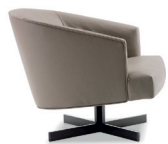
7 MARTIN POLTRONA GIREVOLE CM 78X86 H70